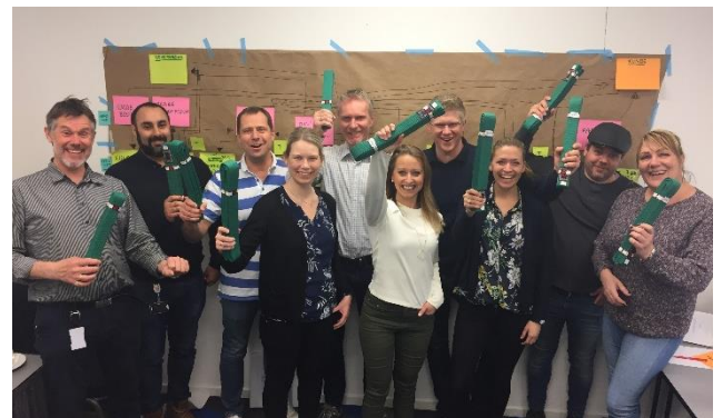
Kurs-deltagere fra Lean grønt belte sertifiseringskurs våren 2018

Våre kursdeltagere anbefaler oss som kursleverandør med 5.5 av 6 poeng på evalueringer