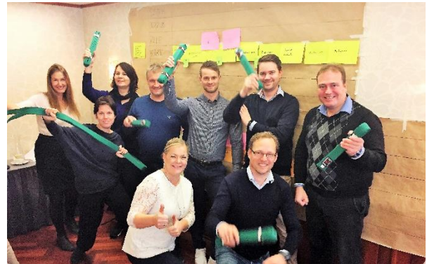
Kurs-deltagere fra Lean grønt belte sertifiseringskurs høsten 2016

Vårt team ønsker å skape uavhengige kunder som høster frukter i mange år. Med lang leder-erfaring på operasjonelt nivå fra internasjonale selskaper leverer vi topp kvalitet. Vi er din løsningsorienterte partner hvor tett kunde-oppfølgning er sentralt og vi setter alltid kundens lønnsomhet som 1. prioritet!