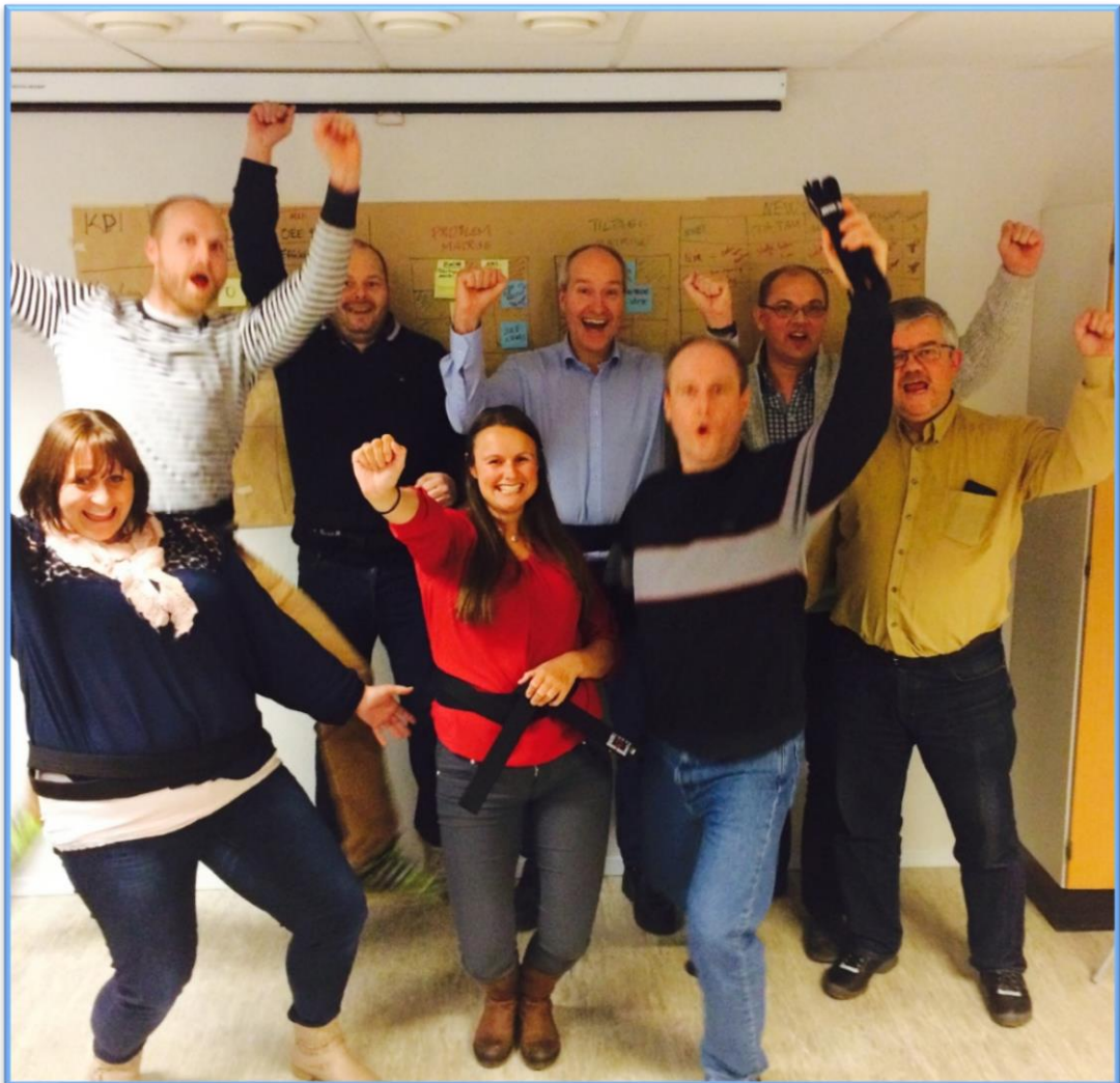
Lean Managers MC og svart belte sertifiserte hos Madisa Consulting AS høsten 2015.