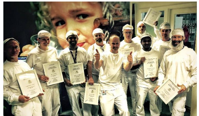
Kurs-deltagere fra Tine SA mottar sine sertifiseringsbevis.

Våre kursdeltagere anbefaler oss som kursleverandør med 5,5 av 6 poeng på evalueringer.